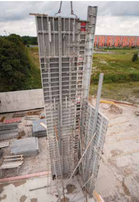
Die Schalung für 15 m hohe Sichtbetonwände wird gestellt.