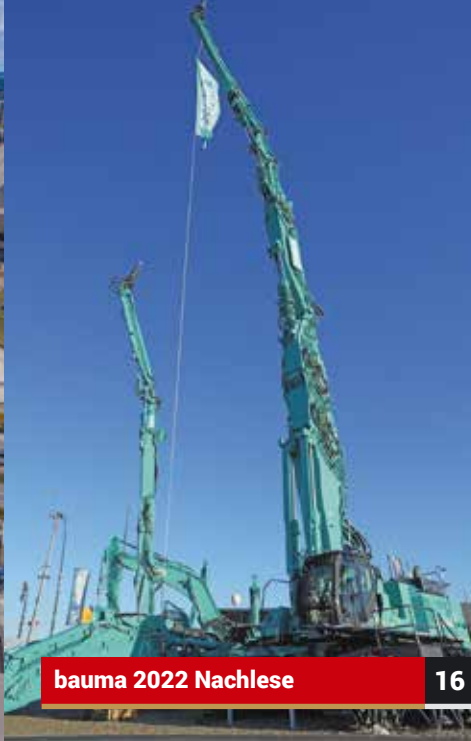
bauma 2022 Nachlese